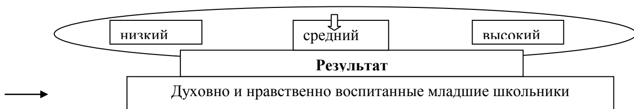
Рис. 1. Модель духовно-нравственного воспитания младших школьников

Ведущей задачей образовательных учреждений и семьи является расширение целенаправленного и контролируемого пространства, обеспечивающего решение задач воспитания личности и создание средствами совместной педагогической деятельности учителей, старшеклассников-кураторов, педагогов дополнительного образования и родителей условий для проявления детьми творчества, самостоятельности, ответственности и духовно-нравственного выбора.